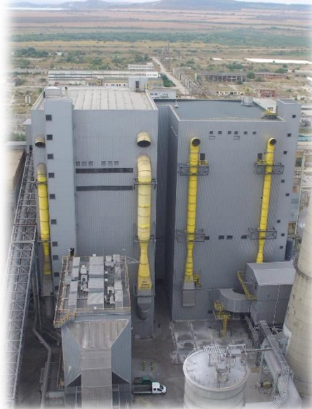
2009 and 2017 - Котли с циркулиращ кипящ слой (Парогенератори 7 и 8) - най-енергийно ефективна технология, CO 2