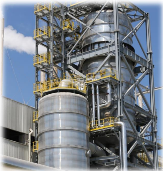
2015 – Нова вакуум дестилационна инсталация - по-ниска консумация на горива и емисии на CO 2