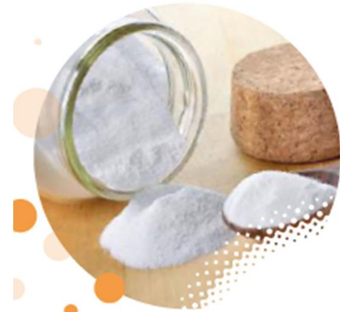
2020/2021- Нова инсталация за бикарбонат .